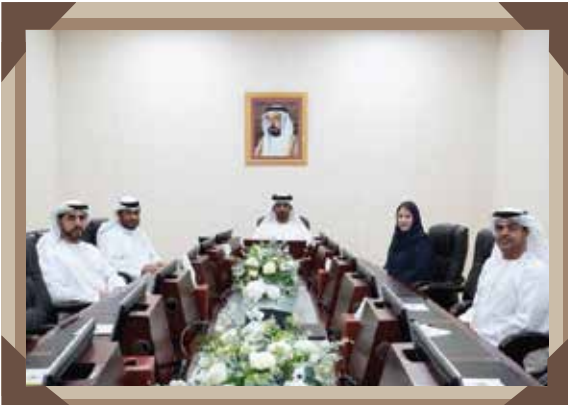
عدد الاجتماعات: 6 / عدد الزيارات: 2