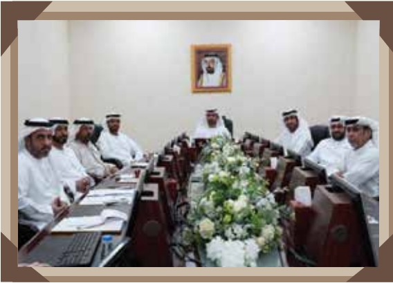
عدد الاجتماعات: 6 / عدد الزيارات: 4