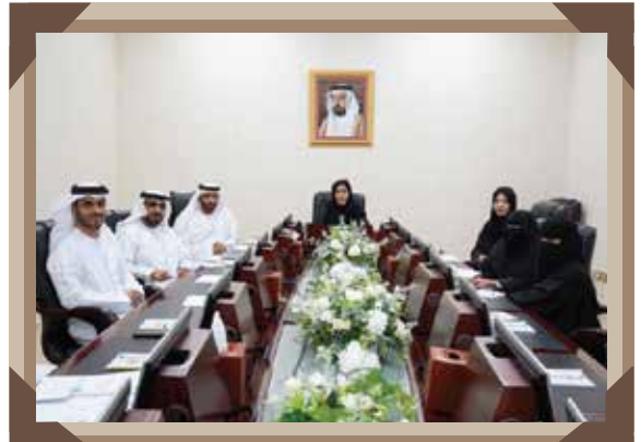
عدد الاجتماعات: 7 / عدد الزيارات: 9