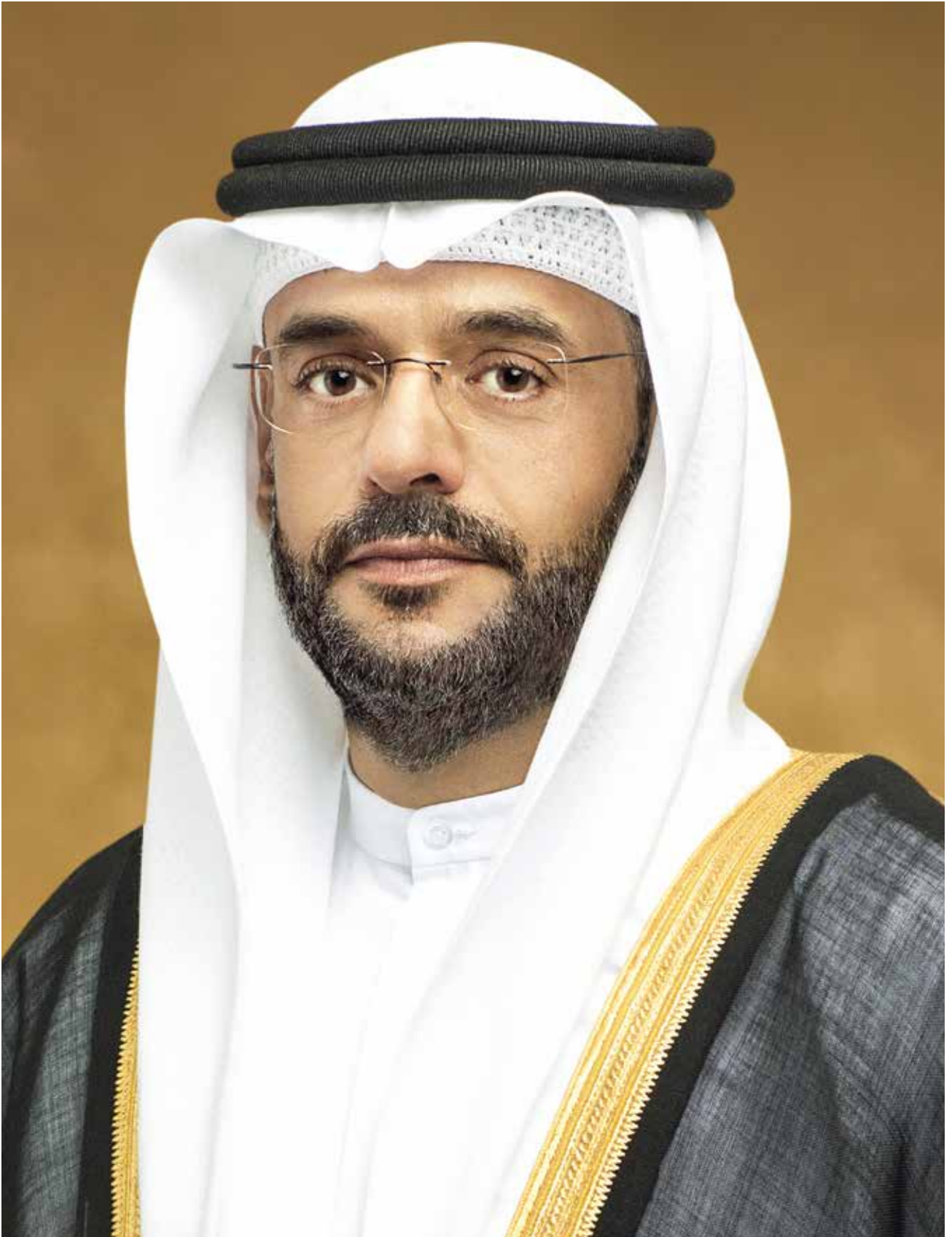
سمو الشيخ سلطان بن محمد بن سلطان القاسمي ولي العهد، نائب حاكم الشارقة رئيس المجلس التنفيذي لإمارة الشارقة