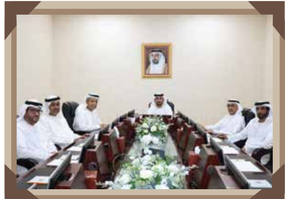
عدد الاجتماعات: 5