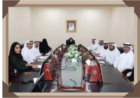
عدد الاجتماعات: 9 / عدد الزيارات: 3

لجنة الشؤون الإسلامية والأوقاف والبلديات وشؤون الأمن والمرافق العامة.