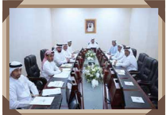
عدد الاجتماعات: 10 / عدد الزيارات: 1