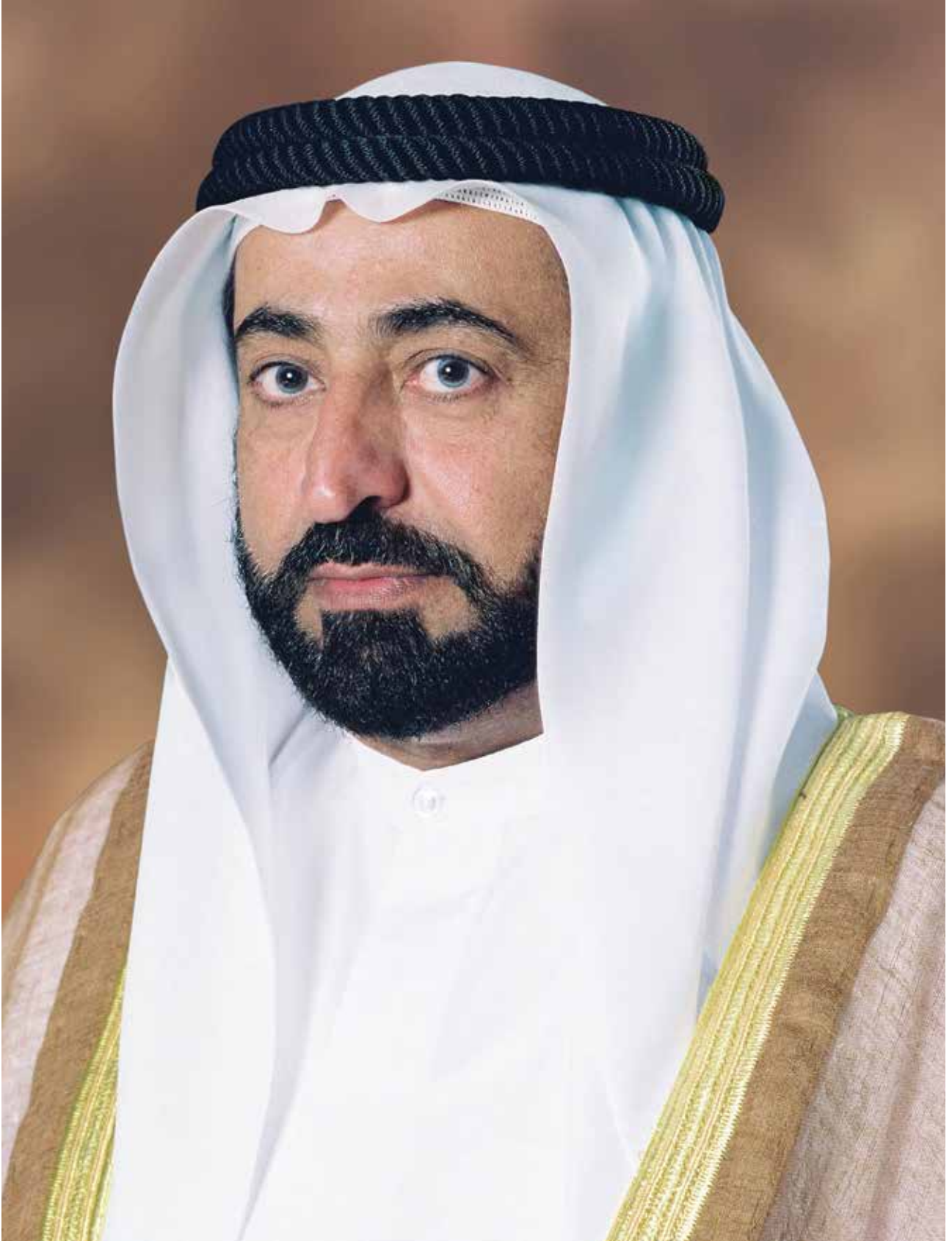
صاحب السمو الشيخ الدكتور سلطان بن محمد القاسمي عضو المجلس الأعلى للاتحاد حاكم إمارة الشارقة