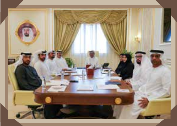
عدد الاجتماعات: 5