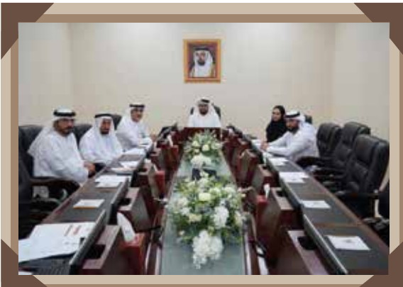
عدد الاجتماعات: 5 / عدد الزيارات: 3